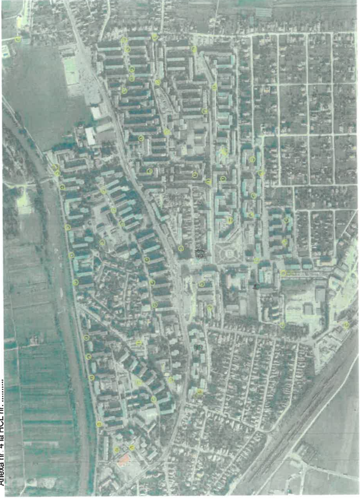
Anexa nr. 4 la HCL nr. ....